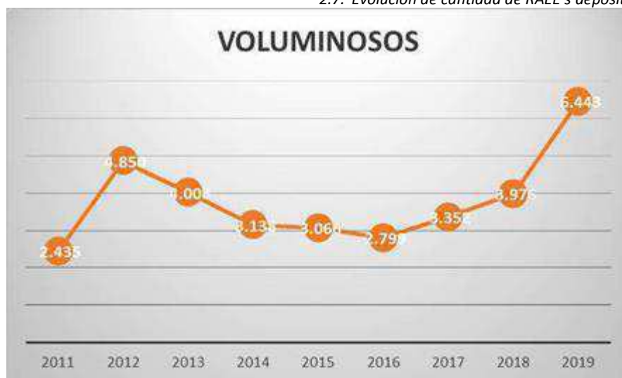
2.8. Evoluci3n de cantidad de voluminosos depositados en ecoparques.