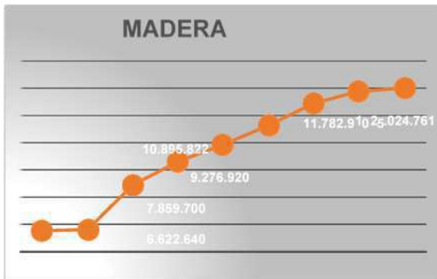
2.4. Evolución de cantidad de madera depositada en eco-parques.