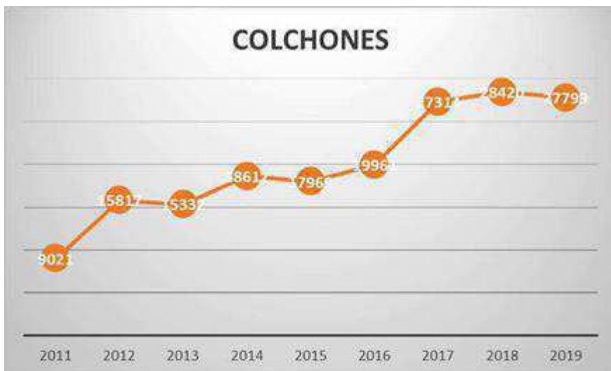
2.1. Evoluci3n de cantidad de colchones depositados en ecoparques.