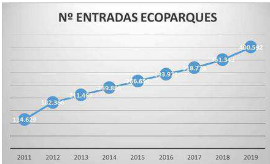
2.9. Evolución número de entradas a ecoparques.