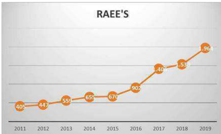
2.7. Evoluci3n de cantidad de RAEE's depositados en ecoparques.