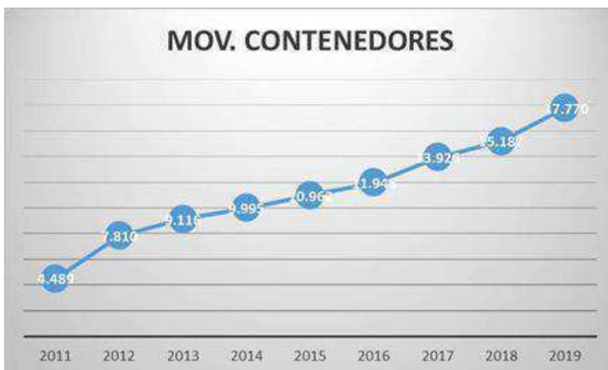
2.10. Evolución movimientos de contenedores realizados