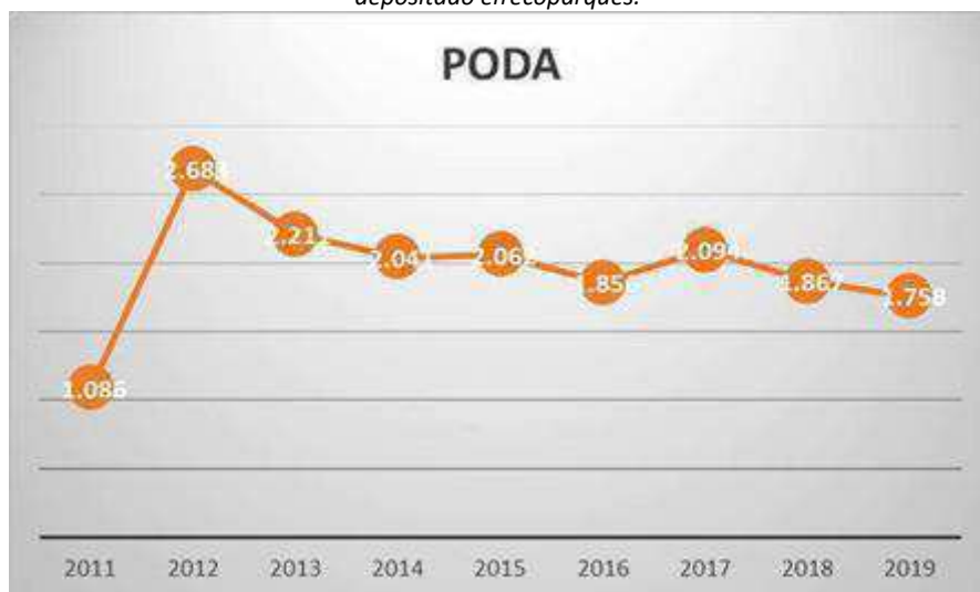
2.6. Evolució de quantitat de poda depositada en ecoparques.