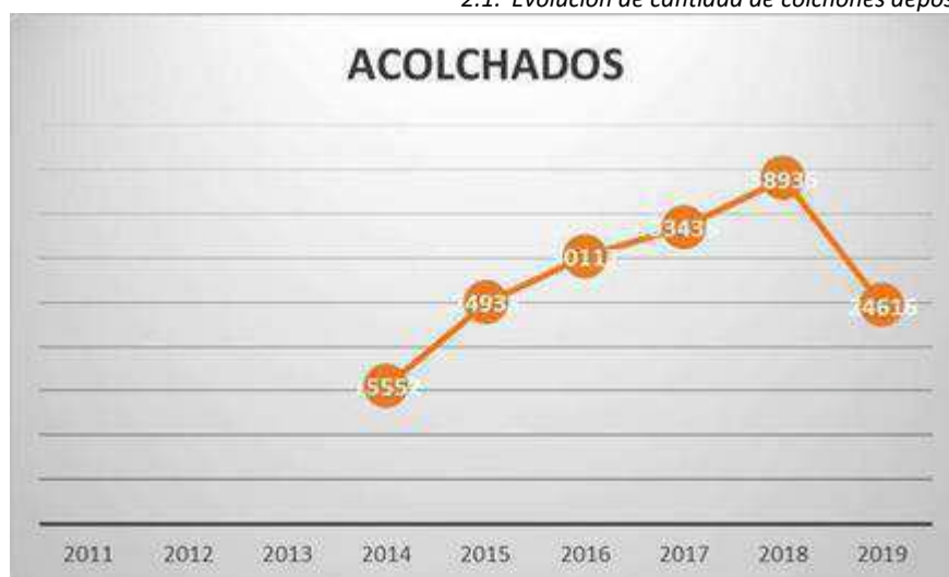
2.2. Evoluci3n de cantidad de acolchados depositados en ecoparques.