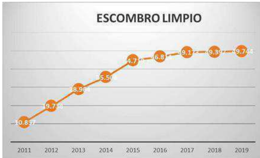
2.3. Evolución de cantidad de escombros limpios depositados en eco-parques.